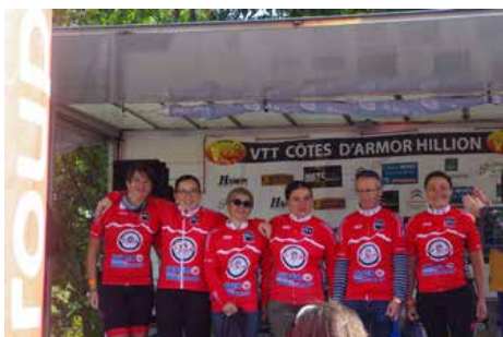
Podium 6H Hillion

La commune a également créé un Pumptrack derrière la salle des sports qui a été inauguré en septembre dernier. Un lieu parfait pour l'entraînement de nos jeunes qui adorent pratiquer le vélo tout en s'amusant !